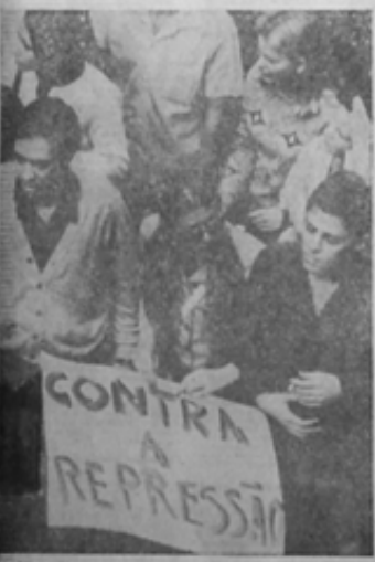
Élio Lillo e Chico Buarque também em Assembleia