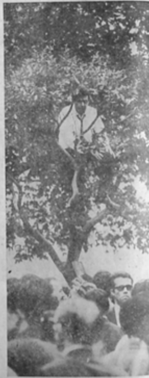
Na Presidente Vargas Wladimir teve milhares seguidores